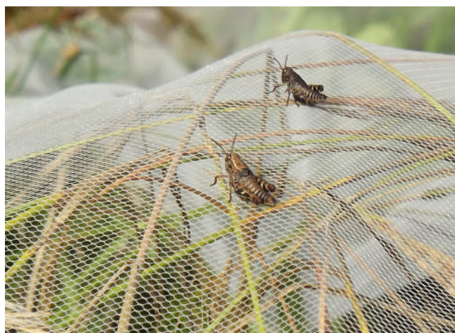
Figura 2: Individui giovani di Calliptamus italicus a diversi stadi di sviluppo..

insetticidi a base di Spinosad o di Deltametrina. La validità dello Spinosad in particolare, è stata confermata dalle prove sperimentali in corso anche su ampie superfici.